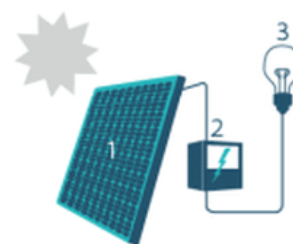
1. Zonnepaneel | 2. Omvormer | 3. Elektrische toestellen

Om de zonnepanelen optimaal te laten renderen, plaatst u ze tussen oostelijke en westelijke richting onder een hoek van 20° tot 60°.